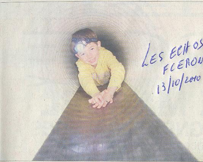
Le speléobox, une des nouveautés du salon Ribambelle 2010, vous attend dès 5 ans pour un parcours semé d'embûches!

Le 16 et 17 octobre, les enfants de 5 à 12 ans ont rendez-vous au Palais des Congrès pour la 10 ème édition du salon Ribambelle! Les parents auront la possibilité, dans le cadre de cet événement unique de Liège, de rencontrer de nombreuses associations qui leur fourniront toutes les informations dont ils ont besoin pour le bien-être de leurs progénitures. Les domaines touchant à l'enfance y sont abordés via des exposants et partenaires, n'oubliez pas toutes les activités, animations, spectacles, conférences, etc.